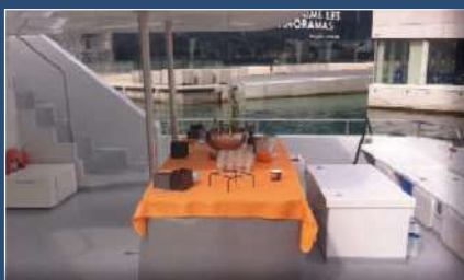
Buffet à bord Buffet on board