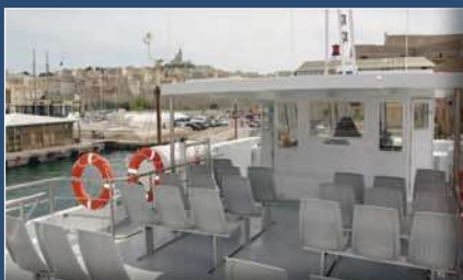
Pont supérieur Upper deck